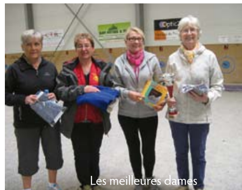
Les meilleures dames

Les joueurs étaient répartis en 12 triplettes, et ce sont donc 6 "matches endiablés" qui débutèrent vers 10H00 pour la première partie.