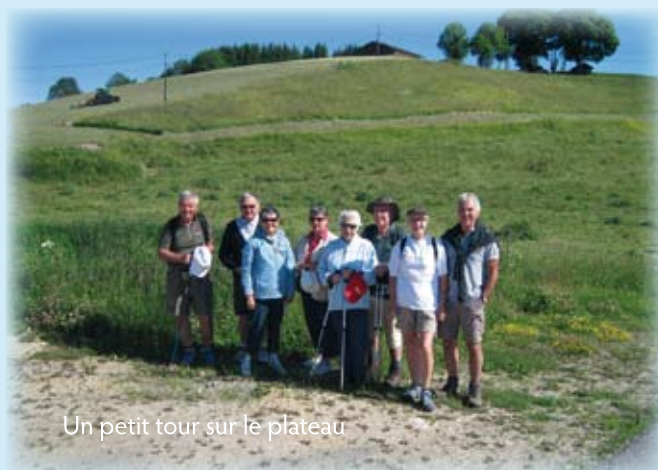
Un petit tour sur le plateau