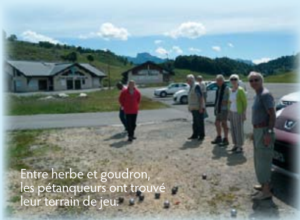
Entre herbe et goudron, les pétanqueurs ont trouvé leur terrain de jeu.