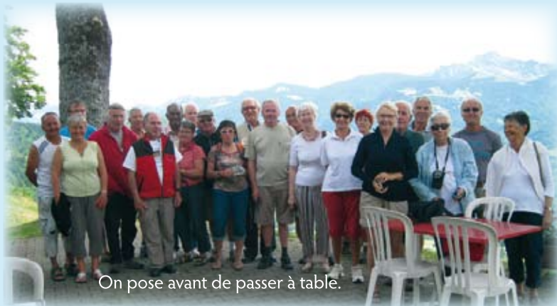
On pose avant de passer à table.